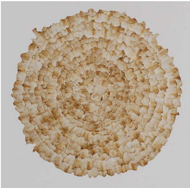
»September Balkon« Papier, ø 42 cm 2015