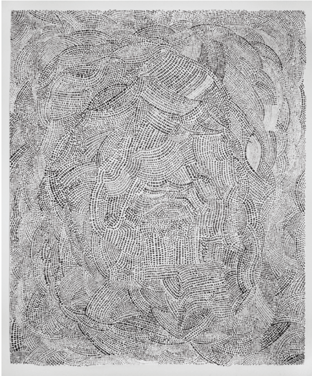
ohne Titel Tinte auf Papier 102,5x85 cm, 2016